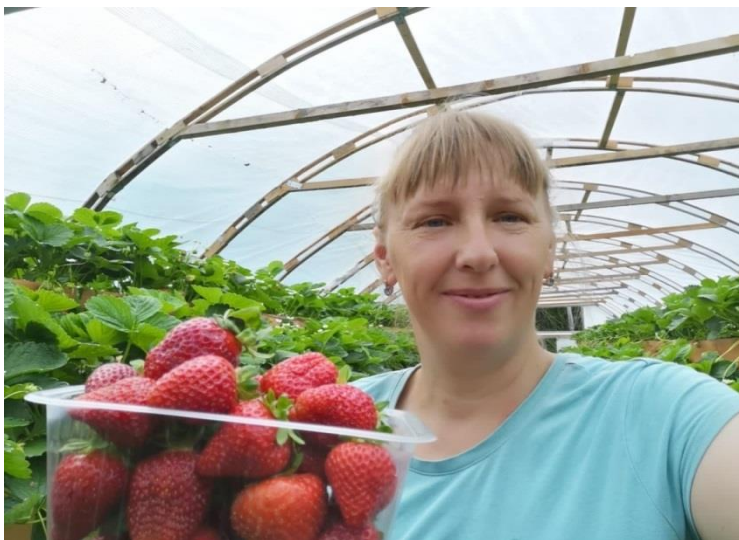
Ведение личного подсобного хозяйства