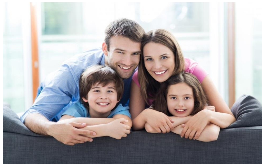
Преодоление трудной жизненной ситуации